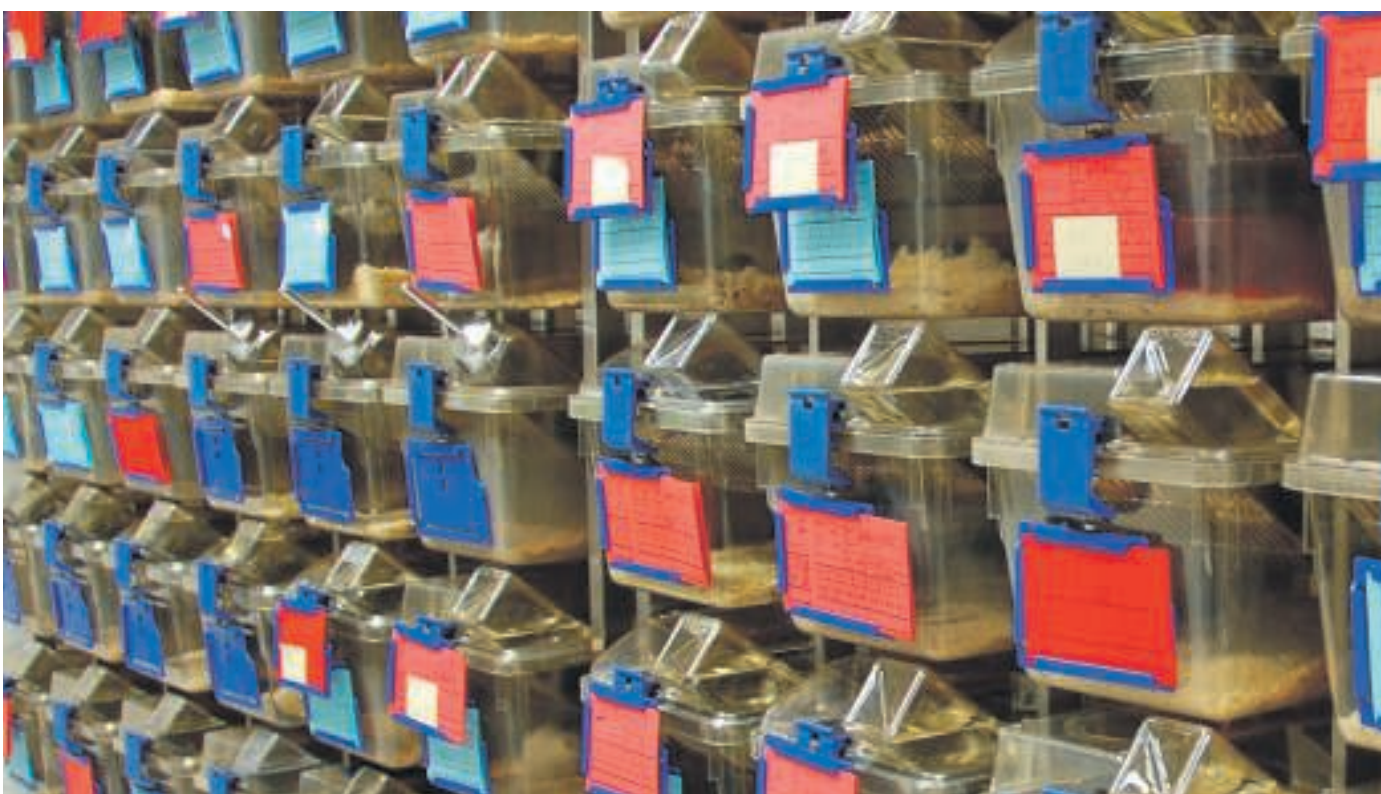
Rund 8000 Mäuse leben im Tierhaus der Leipziger Uni. Die roten Karten markieren weibliche, die blauen männliche Tiere.

Doch diese Transparenz hat ihre Grenzen. Während Tierpfleger Fotos im MEZ erlauben, werden die Tierversuche selbst, die teils im Tierhaus, teils in umliegenden Instituten stattfinden, von der Öffentlichkeit abgeschirmt. Zurzeit ist kein Leipziger Forscher bereit, sich von Medien bei Tierversuchen begleiten zu lassen. Dabei sind die Projekte alles andere als geheim, Versuchsaufbau und